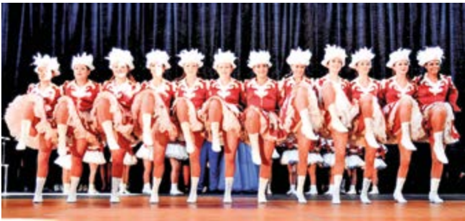
Immer wieder ein schönes Bild: Die Mädels der Prinzen Garde im Gleichschritt.