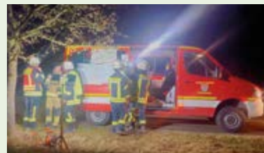
Besprechung der Einsatzleitung während der Personensuche vor unserem Mehrzweckfahrzeug

der Koordination, Lagedarstellung und Funkführung durch unsere Führungsassistenten. Die Fußtrupps der Feuerwehren durchkämmten das Gelände, während das THW mit einer Drohne sowie die Polizei mit einem Hubschrauber den Suchbereich mit Wärmebildkameras erkundeten. Die Polizei suchte zusätzlich einen weiteren Bereich mit Streifen ab. Nachdem der Bereich abgesucht war, beendeten wir die Personensuche nach zweieinhalb Stunden, ohne eine hilfebedürftige Person gefunden zu haben.