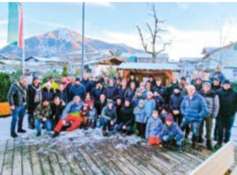
Die Winterfrische genießen bei bestem Wetter

Am letzten Januar-Samstag bestiegen wir den Bus nach Süden, um von Tegernsee aus zur Wallbergmoos-Alm zu wandern. Nach einer Stärkung ging's dann die 6,5 km-Rodelbahn hinunter, bzw. für die Nicht-Sportler mit dem Schneemobil zum Tegernsee. Toller Ausflug, Vielen Dank an unseren Vorstand für die Organisation!