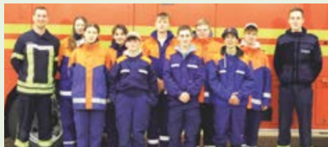
Unsere Jugendfeuerwehler mit den Jugendwarten vor dem ELW2 der UG ÖEL

genau unter die Lupe und lernten so einen weiteren Aspekt der Arbeit im Brand- und Katastrophenschutz kennen.