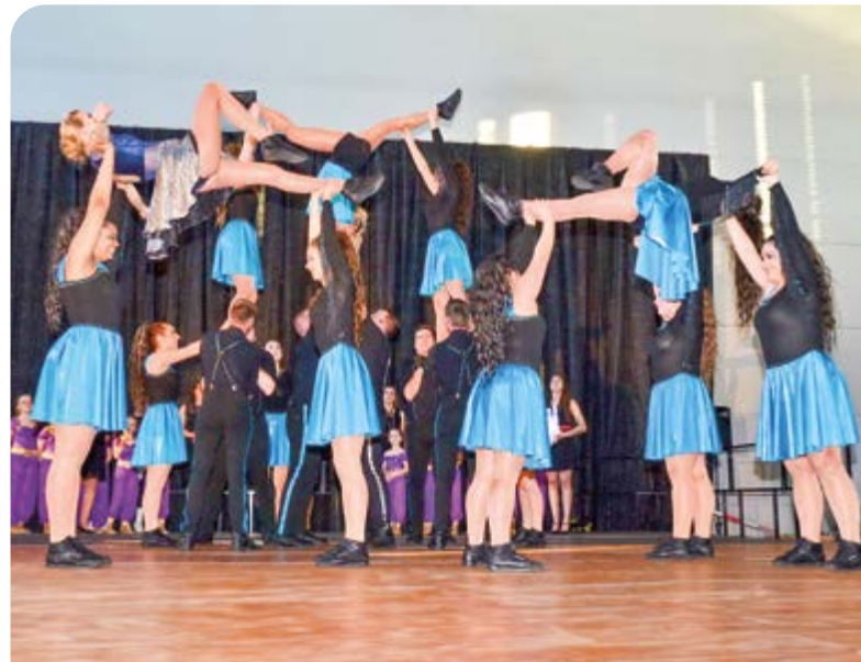
Kraft, Grazie und Artistik zeigten die Burschen und Mädels der Prinzen Garde.

Im Showprogramm glänzte die Kindergarde unter dem Motto „1001 Nacht“. Die Choreographie war kindgerecht, aber trotzdem anspruchsvoll, die Kostüme wie auch die Musik dem Thema angepasst. Nach der vehement geforderten Zugabe hatten OCV-Mitglieder in der Halle ein Spalier wie ein Tunnel gebildet, durch das die Mädels die Halle verlassen konnten. Eine nette Idee, die den Zusammenhalt des OCV untereinander verdeutlichte.