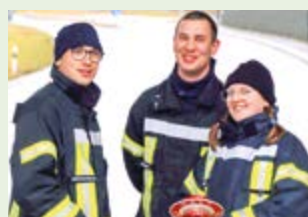
Einsatzkräfte bei der Absicherung des Gaudiwurms

Am Faschingssonntag, den 11. Februar waren wir über mehrere Stunden im Umfeld des „Gaudiwurms“ im Einsatz. Um 12.45 Uhr zu Beginn des Zuges übernahmen wir in Reichertshausen die Verkehrsregelung, so dass der Zug