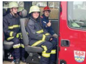
Die Jugend im Gaudiwurm-Einsatz