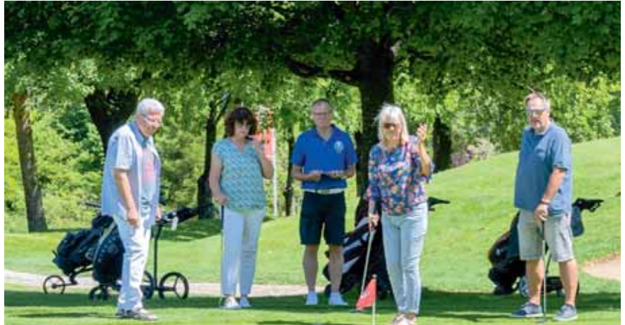
Die Spannung steigt: Wird der Ball ins Loch gehen?

Wer jetzt neugierig geworden ist: Auch an den Sonntagen 21. Juli und 11. August wird es noch weitere Schnuppertage geben. Nicht in diesem Umfang, aber mit garantiertem Spaß. Und für diejenigen, die an diesen Tagen nicht können, findet sich sicher auch eine Lösung.