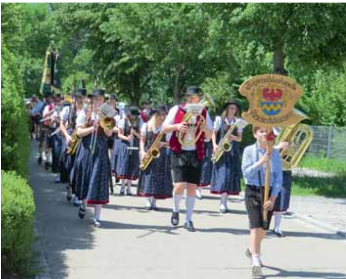
Festumzug durch Reichertshausen