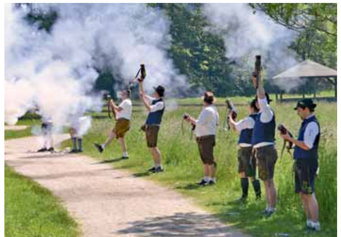
Für ohrenbetäubende Kracher auf der Beck-Wiese sorgten die Hubertusschützen aus Fahrenzhausen-Biberbach.