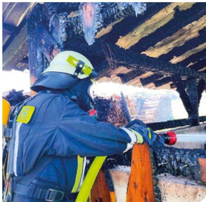
Nachlöscharbeiten unter Atemschutz: Keine Freude im Hochsommer...