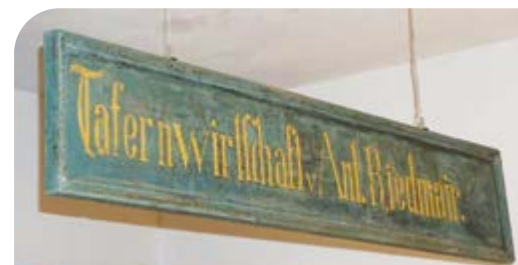
Das alte „Tafernwirtschaft-Schild“ wurde im Gastraum wieder aufgehängt