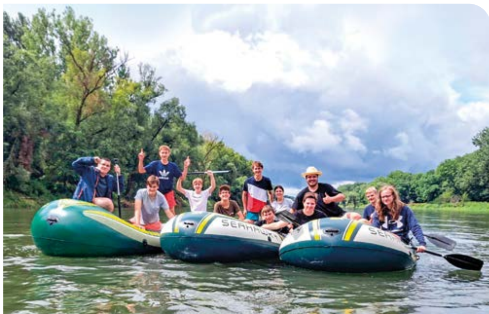
Die Stimmung hält, trotz des nahenden Gewitters...

Aktuelles aus Feuerwehr und Feierwehr gibt's immer aktuell auf unserer Homepage https://pischelsdorf.feuerwehren.bayern/ oder auf Instagram: https://www.instagram.com/ffwpischelsdorf/