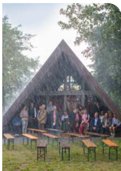
Ein kurzer Schauer unterbrach den Gottesdienst