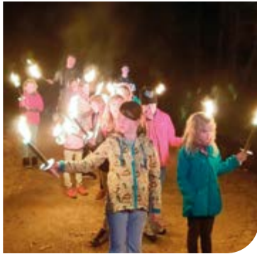
Der Rückweg wurde wie immer mit Fackeln erleuchtet.

Auch heuer konnten wir mit über 40 Kindern aus der Gemeinde die Umgebung erkunden: Am Montagabend trafen wir uns mit 15 Betreuern, um gemeinsam mit den Kindern über Oberhausen