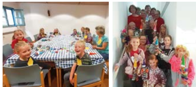
Bericht und Fotos: Kath. Frauenbund Reichertshausen

Auch wir haben uns wieder am Ferienprogramm beteiligt. Den Kindern und uns machte es viel Spaß, aus runden Filzscheiben und Perlen einen Clown zu basteln. Voller Stolz wurden diese den abholenden Eltern sofort gezeigt.