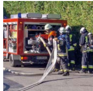
Der Löschangriff wird vorbereitet