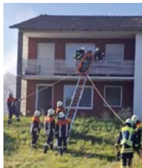
Rettung einer Person aus dem ersten Stock

Die komplett ehrenamtlich (d. h. ohne Bezahlung!) tätigen Feuerwehrfrauen und -männer in unserer Gemeinde verfügen über die Ausrüstung und Fähigkeiten, auch komplexere Einsätze zu bewältigen und koordiniert zusammenzuarbeiten.